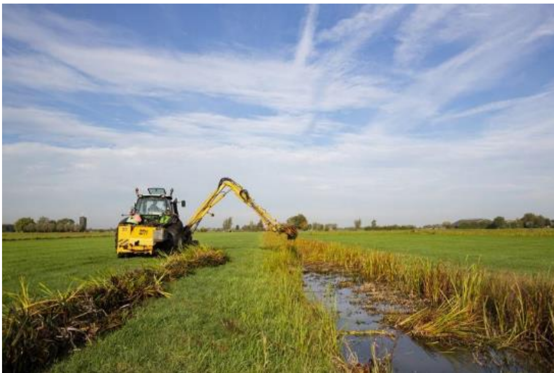
Ecologisch slootschonen

Baggerspuiten is bedoeld om delen van de sloot op diepte te houden. In dit beheerpakket moet dat met de baggerpomp, niet met de maaikorf, omdat dan de bodemvegetatie te veel beschadigd wordt.