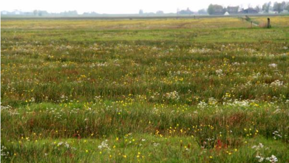
Kruidenrijk grasland

Op kruidenrijke graslanden komen de kruiden van nature in grotere aantallen voor en zijn verspreid over het hele perceel. De zode is open en divers van structuur door de vele kruiden met veel bloei-stengels en weinig blad. Dit heeft ook als voordeel dat kuikens zich goed kunnen voortbewegen in het grasland.