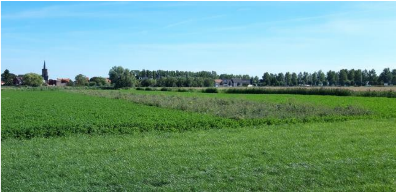
Gefaseerd gemaaide luzerne

Een aantal eiwitgewassen zijn vanwege de structuur en het feit dat ze tot bloei komen aantrekkelijk voor akkervogels, zeker in combinatie met akkerranden en andere permanente akkerhabitats. In dit beheerpakket is daarom de teelt van veldbonen en erwten opgenomen. De data waartussen het gewas aanwezig moet zijn, zijn afgestemd op de teelt van deze gewassen.