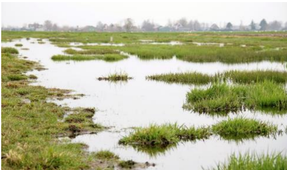
Plas dras in Krimpenerwaard

Het pakket met startdatum 15 februari heeft als voordeel dat de plasdras aanwezig is bij de start van het weidevogelseizoen, het pakket met startdatum 1 maart biedt een langere tijd voor de ontwikkeling van de bodemfauna. De plasdrassen in de periode mei-augustus hebben een functie als opvethabitat voor de vogels. De plasdras in november-december is bedoeld voor overwinterende soorten zoals de Kleine zwaan.