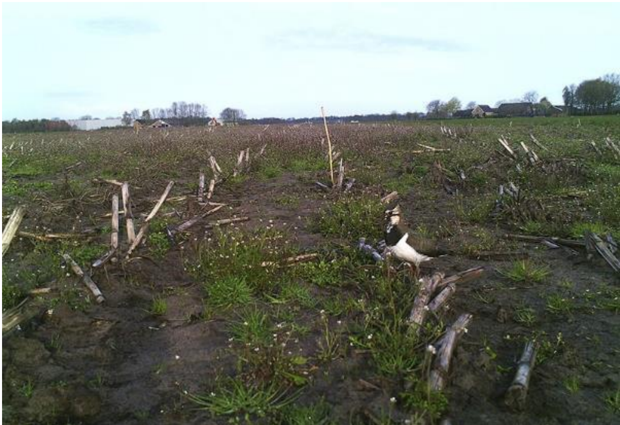
Kiebit op bouwland met uitgesteld zaaien, fragment

Contact met veldmedewerkers en/of vrijwilligers is erg belangrijk. Zij brengen de nesten en kuikens in kaart, waarbij zoveel mogelijk vanaf de rand van het perceel gemonitord wordt. Nesten worden geregistreerd, het liefst digitaal. Nesten worden beschermd tegen verstoring via verplaatsen, nestbeschermers of via uitstellen van zaaien van het gewas.