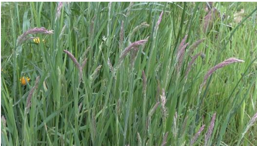
Witbol domineert hier de vegetatie, terugdringen door tweede helft mei te maaien

Dit pakket is bedoeld voor percelen waar je (extensief) kruidenrijk grasland wilt ontwikkelen, maar die nu nog zeer soortenarm zijn. Deze percelen worden bijvoorbeeld gedomineerd door witbol of bestaan nog geheel uit Engels raaigras. Verschralen van de bodem bevordert de kruidenrijkdom, dat wil zeggen dat er niet wordt bemest, er geen bagger wordt opgebracht en het maaisel wordt afgevoerd. Ook door beweiding achterwege te laten, voorkom je bemesting van het perceel en zorg je voor een snellere verschraling van het perceel. Vroeg maaien is van belang om het dominantiestadium van witbol te doorbreken, dan wel om zoveel mogelijk voedingsstoffen af te voeren. Omdat de eerste snede in het broedseizoen is, zal er naar nesten gezocht moeten worden.